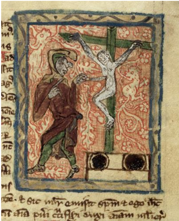
Figure 1 Adam de Bristol