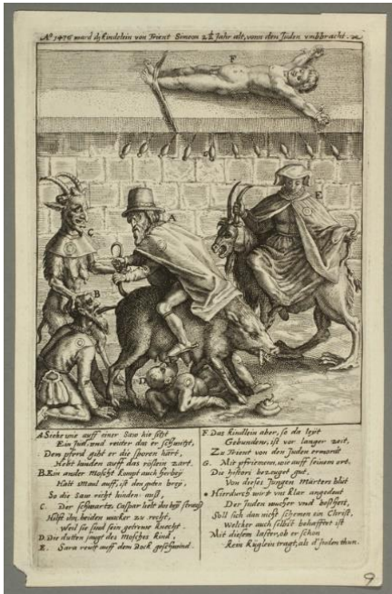
Figure 3 Simon de Trente crucifié, Sorcière juive sur un bouc, Juif sur une Judensau, Diable, Gravure, XVIIe siècle