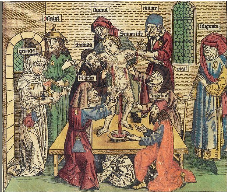
Figure 4 Martyrdom of Simon von Trent, depiction from the Nuremberg World Chronicle by Hartmann Schedel, 1493, DP